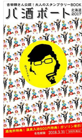
図1 酒蔵ツーリズムの例『酒蔵レポート』

のことで、近年では「LINE BOT AWARDS」と呼ばれるコンテストが開催された。また、 酒蔵ツーリズム と呼ばれる日本酒をテーマにして地域活性化を図る取り組みが行われていたり、日本酒と観光を結びつけた動きが多く行われている。