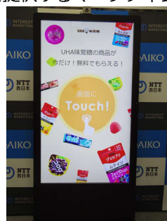
[2]カメラ付きデジタルサイネージで属性にあったサンプル配布を促進するマーケティングツールが登場 https://wirelesswire.jp/2016/03/51104/