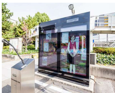
[4]名古屋工業大学双方向音声案内デジタルサイネージ「メイちゃん」 http://mei.web.nitech.ac.jp/